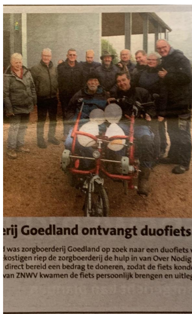
Stukje in de krant